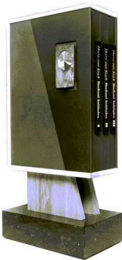
Bodoni Initialis (1993). Drie linnen banden met tekstboek en 26 reliëfdrukken 50x65cm. Houten kast gedeeltelijk bekleed met kunstleer, gepolijste voet van Belgisch graniet, bronzen zegel van Oscar Goedhart Hoogte 102 cm, breedte 51 cm. Oplage 7 exemplaren

de letters E en Q (2x2 meter) en een wandreliëf van geloof ik 24 meter breed in een school waren wel het meest markant daarvoor. Uit mijn 'Bodoni Initiales' zijn de a, b en de c twee jaar geleden nog gebruikt voor een beursstand van de firma Hoeka uit Deurne. Die bouwde ik in een timmerfabriek en werden afgespoten door een specialist. De stand zelf kreeg een hoge Europese prijs voor idee en uitvoering en ik was dus niet de enige die gelukkig was met dit gigantische werk.