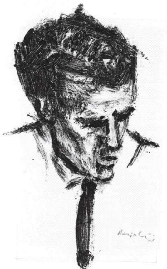
Harry van Kuyk Portret van een schaker Monotype 1968