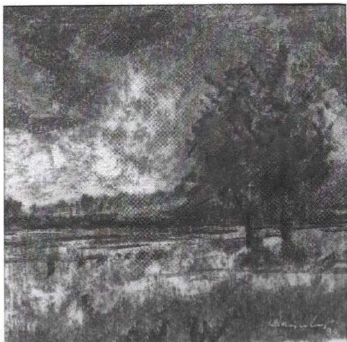
Harry van Kuyk Een natte impressie van de Ooijpolder Houtskoolschets op ware grootte 1999.